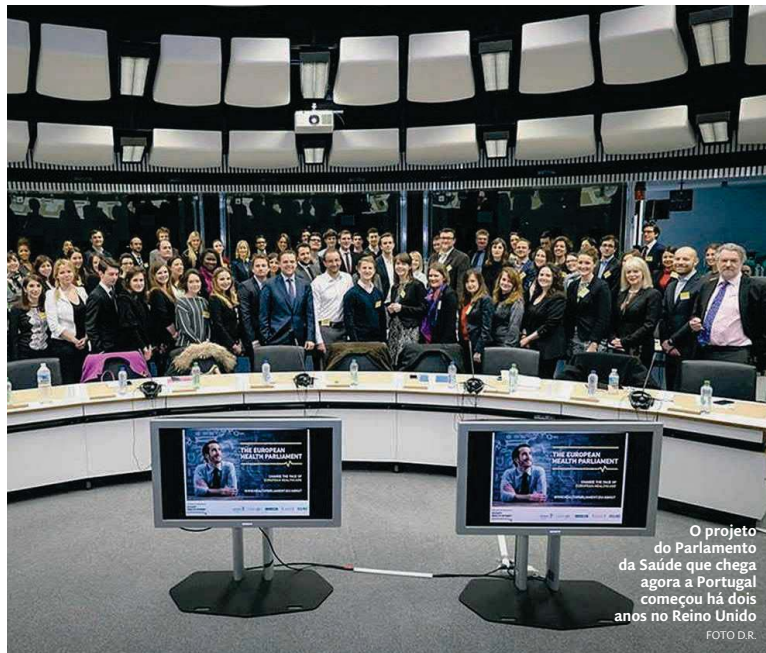
O projeto do Parlamento da Saúde que chega agora a Portugal começou há dois anos no Reino Unido

Seleção Estão escolhidas as 60 pessoas que participam no Health Parliament Portugal e que em 2017 debaterão as políticas de saúde para o país